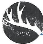
Bündnis für Wald und Wild e.V.

Bündnis für Wald und Wild e.V. Hauptstraße 16 37351 Helmsdorf