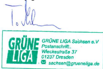
GRÜNE LIGA Sachsen e.V.

Bündnis für Wald und Wild e.V. Hauptstraße 16 37351 Helmsdorf